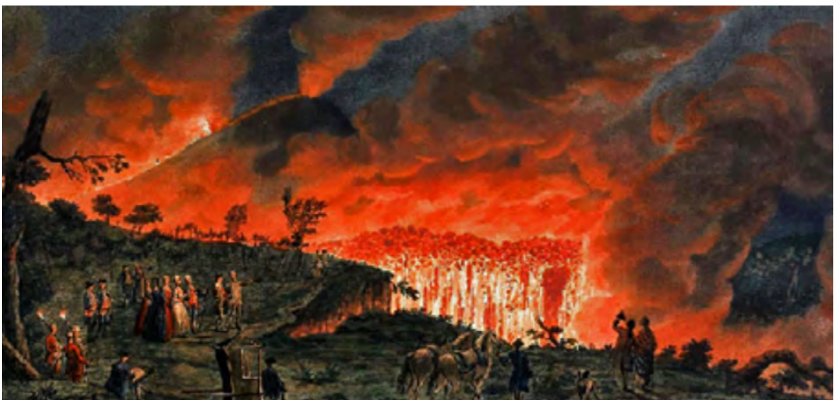
1771: Picknick mit Blick in die Küche des Vesuv - Pietro Fabris - Plate XXXVIII (1771)

"A night view of a current of lava, that ran from Mount Vesuvius towards Resina, the 11th of May 1771 when the Author had the honor of conducting their Sicilian Majesties to see that curious phenomenon" (Sir William Hamilton)