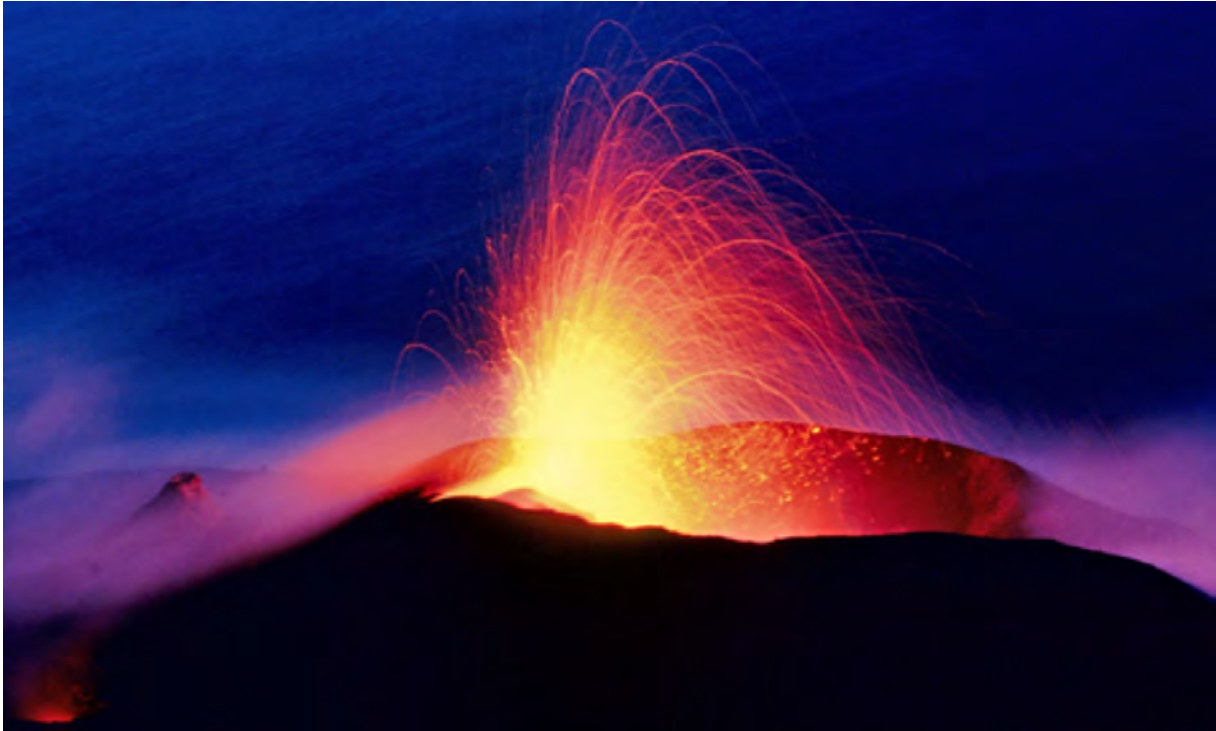
Vulkan Stromboli - 300 Ausbrüche am Tag © Kain Karawahn 1999

Der Vulkan Stromboli ist regelrecht modelliert in eine griechisch-antike Gegenwart der Empedoklischen Naturphilosophie: Feuer, Wasser, Erde und Luft. Er ragt vor Sizilien 900 Meter aus dem Tyrrhenischen Meer, gehört zur Gruppe der Äolischen Inseln (UNESCO Welterbe) und bricht wissenschaftlich dokumentiert ca. 300 Mal am Tag aus. Je nach Aktivitätsphase und Wittersituation ist daher das Zusammenspiel der „Vier Elemente“ ununterbrochen zu sehen, zu hören, zu fühlen und zu riechen. Ein Aufstieg zum Gipfel samt Blick in den Krater ist ebenso möglich wie das anspruchsvolle Wandern an des Vulkans Küste entlang.